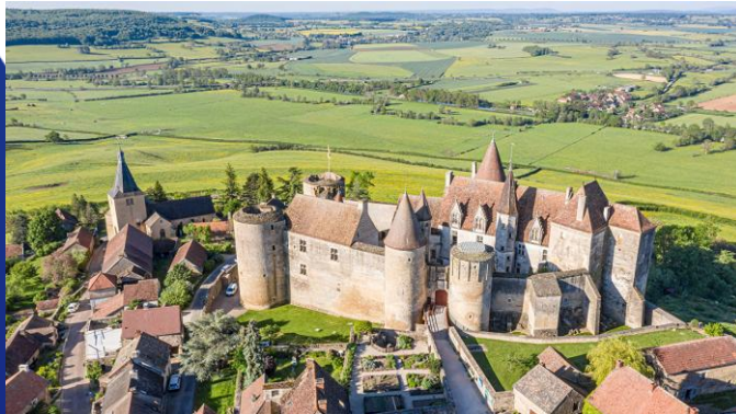
BESSE EN CHANDESSE